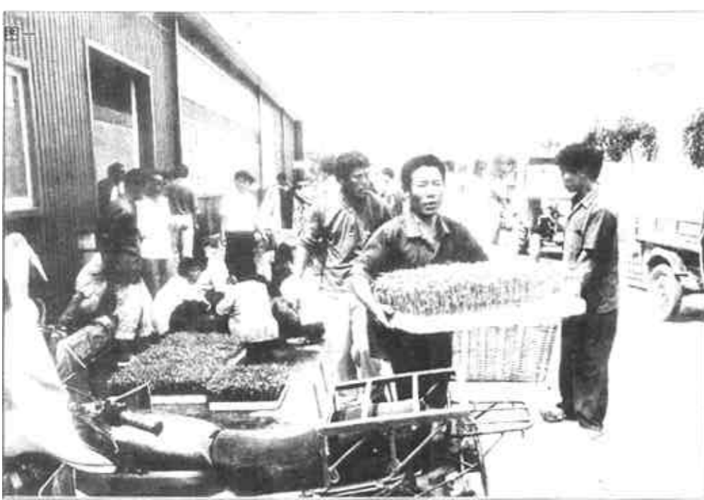
广饶县大王农茂集团兴建的高科技育苗室积极向社会开放，周边县区前来订苗、购苗的络绎不绝，收到良好的社会效益和经济效益。

代酶和纤维素酶能分解饲料中的粗纤维、提高饲料消化利用率；同时可提高畜禽免疫力；还能消除圈舍粪便恶臭、改善生态环境。应用后，可基本上不用抗生素，从而达到绿色养殖，生产出无污染畜产品。(均据新华社)